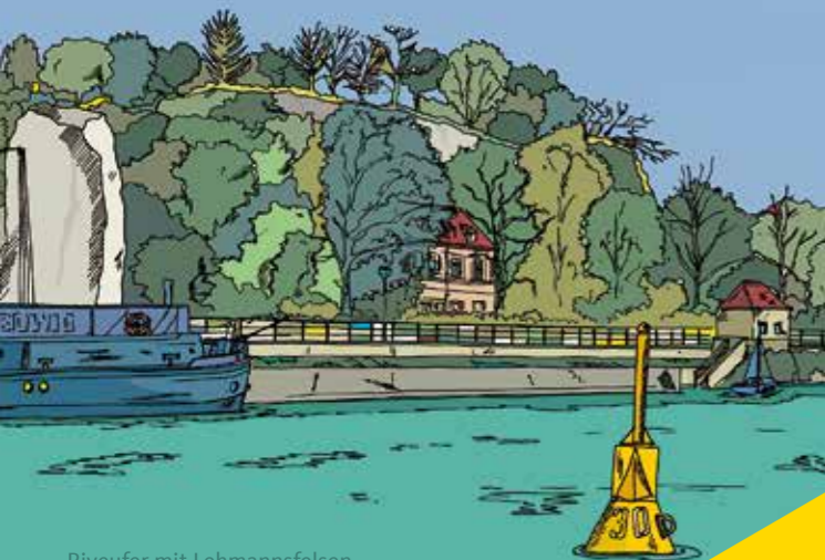
Riveufer mit Lehmannsfelsen

Abbildungen Titel und Rückseite: Bilder (Ausschnitte) aus der halleischen Sammlung Berg Weitere 48 Halle-Motive dieser Art (incl. Rahmen, Passepartout und Signatur) unter www.sammlung-berg.de und in der Halle-Info am Markt .