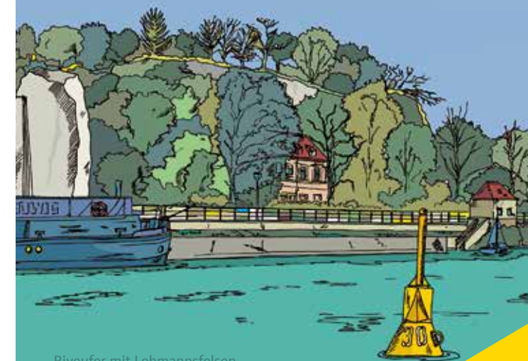
Riveufer mit Lehmannsfelsen

Abbildungen Titel und Rückseite: Bilder (Ausschnitte) aus der halleschen Sammlung Berg Weitere 48 Halle-Motive dieser Art (incl. Rahmen, Passepartout und Signatur) unter www.sammlung-berg.de und in der Halle-Info am Markt .