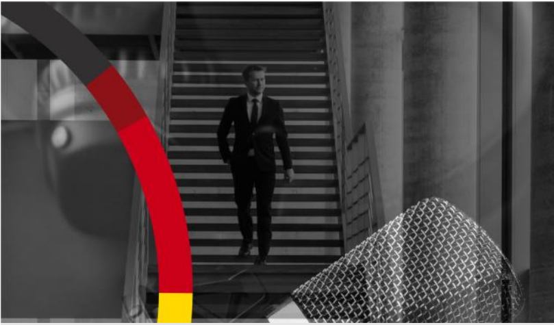
Titelbild meines neuen Podcasts „Bernstiels Blickwinkel“